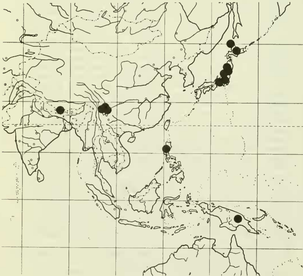
Abb.1: Verbreitung von Amygdalaria aeolotera

Die als Lecidea aeolotera aus Luzon, als Huilla alpina Zahlbr. und H. insularis Zahlbr. aus Szetschwan, als Lecidea calopiacoides Zahlbr. aus Yünnan und als Lecidea cephalophora Lamb aus Japan beschriebene Art (HERTEL 1977) wurde von HERTEL (1977) für Nepal nachgewie-